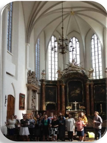
"EME prayer group singing."