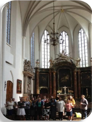
Grupo de Oración de EME cantando

Nuestro equipo de personas de toda Europa bellamente mezclados y el Espíritu de Dios uniéndonos en un poderoso ejercito de oración. En el Brandengurge Gate, el equipo comenzó a cantar espontáneamente. Oramos en muchos lugares y cantamos en estaciones de trenes, en trenes, en las calles mas dramáticamente en una gran catedral. Debido al canto, hubo muchas oportunidades para invitar a personas a la iglesia. En el servicio de domingo, habían 15 visitantes. Un bello Espíritu impregnaba el servicio y los pasillos estaban llenos de personas. Uno recibió el Espíritu Santo y fue bautizado. –Jerolyn Kelley, EME Misionera y Directora de la Comisión de Oración.