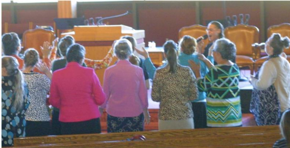
Orar de nossas crianças!