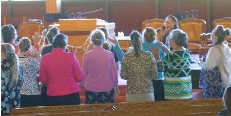
Bidden voor onze Kinderen!