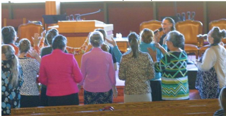
Modlitba za naše děti!